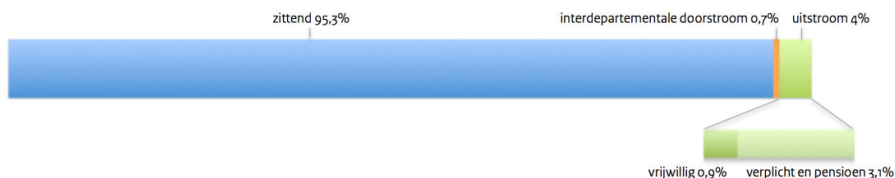
Figuur 1: Uitstroom (naar baan buiten het Rijk, pensioen of arbeidsongeschiktheid) en interdepartementale doorstroom in 2013

In 2013 was 14,4% van de medewerkers bij het Rijk intern functiemobiel: deze mensen vonden een nieuwe functie binnen het eigen organisatieonderdeel (bijvoorbeeld ministerie, uitvoeringsdienst, inspectie). Precies 10% hiervan was vrijwillig intern mobiel, 4,4% wisselde verplicht van functie, bijvoorbeeld als gevolg van een reorganisatie. Dit zijn ongeveer dezelfde cijfers als in 2011. Ze zijn vergelijkbaar met de cijfers in andere delen van het openbaar bestuur (gemeenten, provincies).